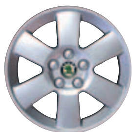
Leichtmetallfelge BAND 15" (Serie bei Elegance, Option für Ambiente) Pneu 195/50 R 15