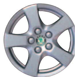
Leichtmetallfelge SPRINT 14" (Optional für Classic) Pneu 185/60 R 14