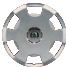
Stahlfelge 15" (Serie bei Ambiente) Pneu 195/50 R 15