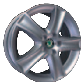
Leichtmetallfelge POLI 16" (Optional für Ambiente und Elegance) Pneu 205/45 R 16