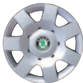
Stahlfelge DURON 14" (Serie bei Classic) Pneu 185/60 R 14

• = Serie X = Sonderausstattung - = nicht lieferbar